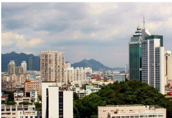
温州市区

温商在现在的经济中已经占据了无法代替的位置，商业是这里的关键词，山水江海交融是这里的特色，文化则是这里的底蕴。